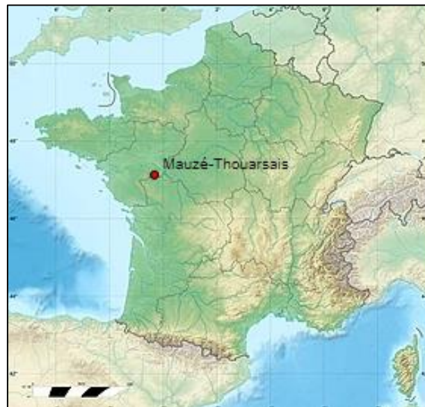
Figure 1 - Situation régionale du site

Le site se situe en totalité sur le territoire des communes de Mauzé-Thouarsais et Saint-Jacques-de-Thouars au lieu-dit la Gouraudière dans le département des Deux-Sèvres (79), à quelques kilomètres au Sud-Ouest de Thouars. A noter que depuis le 1 er janvier 2019, une nouvelle commune s'est constituée en lieu et place des communes de Mauzé-Thouarsais, Missé, Sainte-Radegonde et Thouars. Son siège est fixé à l'hôtel de ville et elle porte le nom de "Thouars". Les communes de Mauzé-Thouarsais, Missé et Sainte-Radegonde sont devenues des communes déléguées.